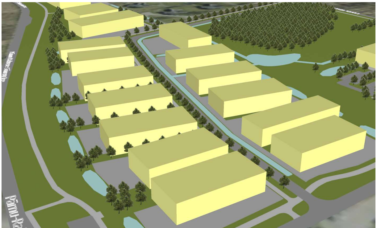
Vaade kruntidele Pos 1 kuni Pos 16