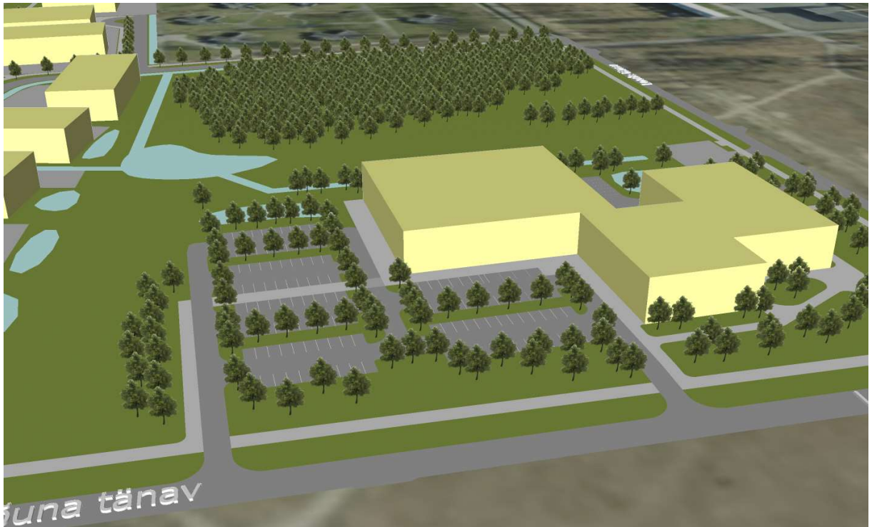
Vaade krundile Pos 17 (eesplaanil) ja Pos 18 (haljasala tagaplaanil)